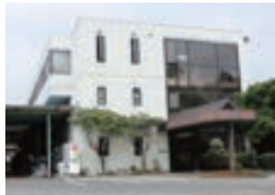
小山工場 Oyama Plant